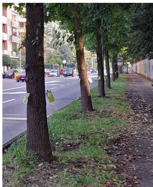
Esemplari trattati con innovativo sistema brevettato di endoterapia radicati presso il Comune di Veduggio al Lambro (MB), allo scopo di contrastare il parassita di recente introduzione Takahashia japonica